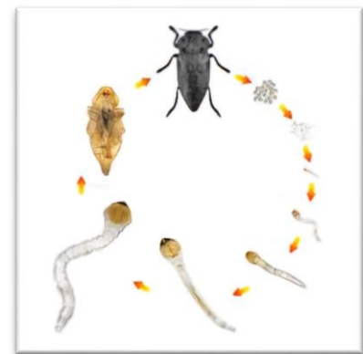
Фотография 2. Жизнен цикъл на черна златка

Възрастното насекомо е сравнително едър бръмбар, с матов черен цвят, който достига на дължина до 3-3,5 см. Яйцето е млечно бяло, твърдо, непрозрачно. Новоизлюпената ларва е белезникава, червеобразна, без крака, с дължина 4-5 мм, а ларвата от последна възраст достига до 6,5 см. Какавидата е бледожълта и достига дължина до 3,5 см.