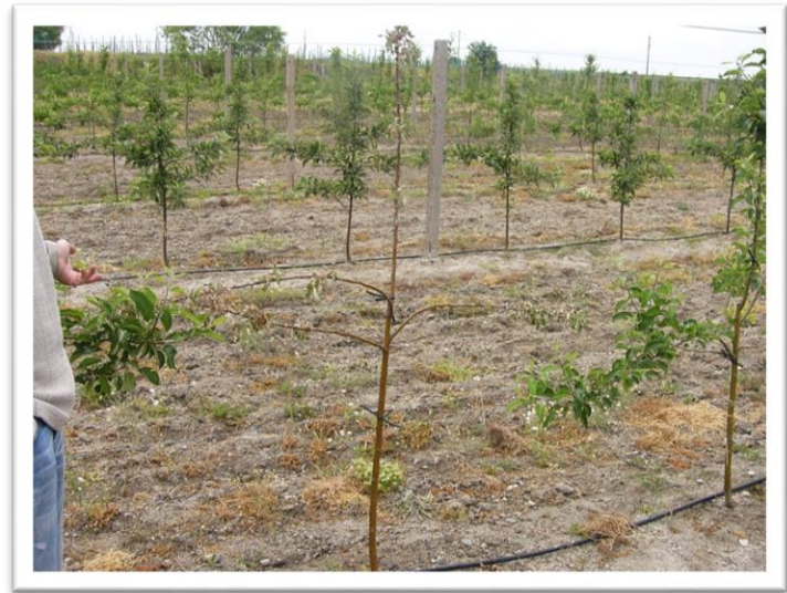
Фотографии 14 и 15. Нападнати млади дървета от черна златка