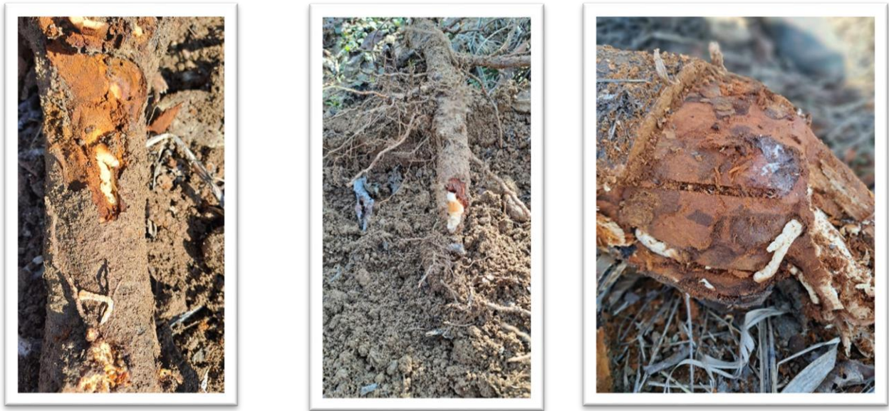
Фотографии 11, 12, 13. Ларва

Когато ларвата си направи какавидната камера, кората над нея се напуква и формата и големината ѝ ясно се очертават.