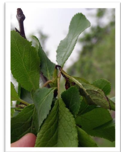
Фотография 6. Повреди от възрастното

✉ Гр. София, 1606, бул. "Пенчо Славейков" № 15А