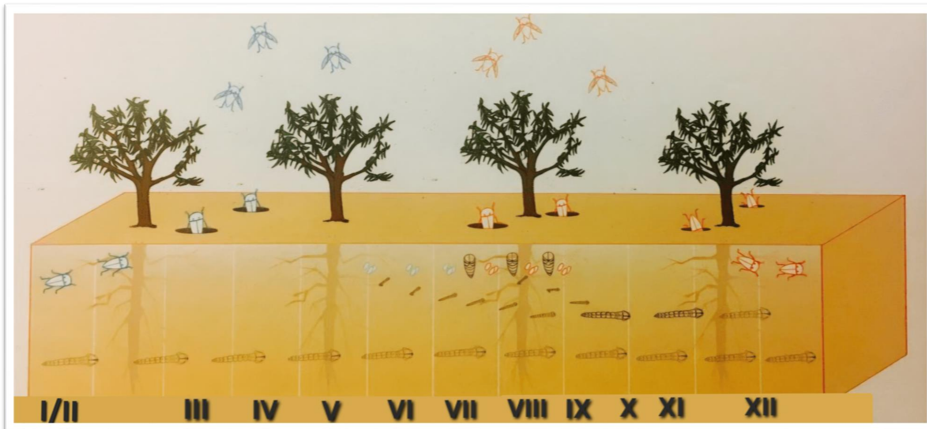
Фотография 16.

✉ Гр. София, 1606, бул. "Пенчо Славейков" № 15А