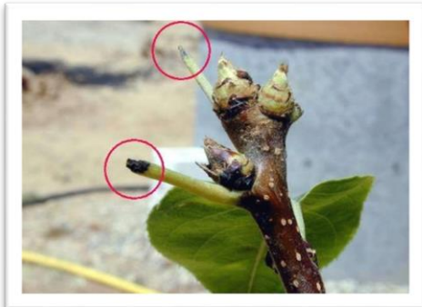
Фотография 5. Повреди от възрастното

младите клонки бръмбарът прави нагризвания по кората. Освен това прегризва младите върхни леторасти, които или падат, или увисват на част от неизгризаната кора и така изсъхват. В овощните разсадници често се срещат не