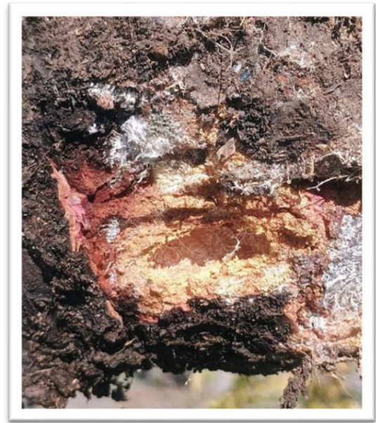
Фотография 8. Повреди от ларва

По нападнатите части се появява потъмнял и слабо хлътнал участък, който показва хода на ларвата към корена на дървото. Този признак се забелязва на повърхността на кората и се наблюдава по-добре при сливовите дървета, които имат по-тънка кора на корена. При кайсията и прасковата входът, през който се вгризва ларвата, е трудно забележим, но на същото място се наблюдава характерно изтичане на смола.