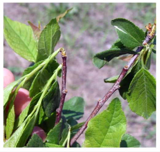
Фотография 4. Повреди от възрастното

Имагиниралите бръмбари изгризват отвор и излизат навън. Има два периода, на поява на възрастното: първи - през пролетта (март - април), когато излизат презимувалите и втори, когато се появяват възрастните от новото поколение - в края на юли и август.