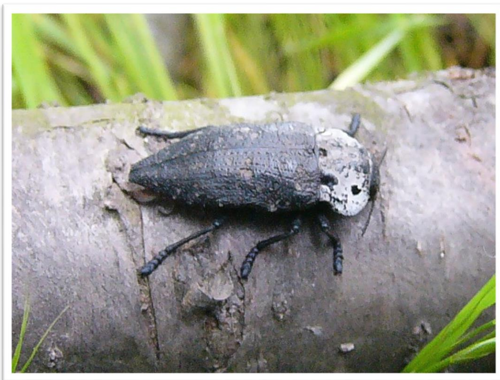
Фотография 1. Възрастен екземпляр на черната златка ( Capnodis tenebrionis )

Насекомните неприятели, които прекарват една част от своето развитие във вегетативните органи на растенията, най-вече в кората и дървесината, причиняват повреди по растенията, които постепенно ги отслабват и често довеждат до загиването им. В овощните градини често се срещат изсъхнали дървета, нападнати от такива вредители. Черната златка ( Capnodis tenebrionis ) (Coleoptera: Vuprestidae) (Бръмбари: сем. Бронзовки) нанася сериозни поражения, основно по костилковите овощни видове, както в овощните и декоративни разсадници, така и в овощните градини.