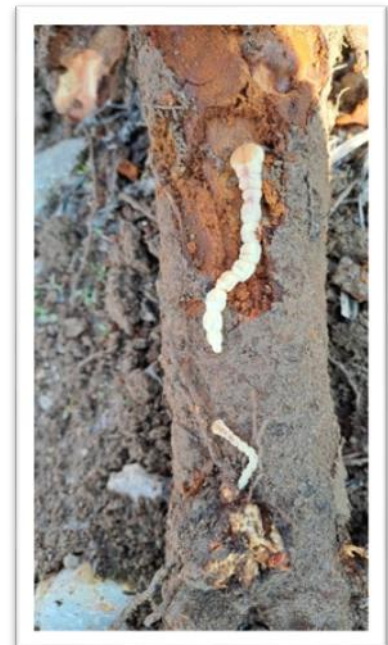
Фотография 10. Ларва в стъбло, източник: ОДБХ Русе

лесно се откриват при опипване с пръсти.