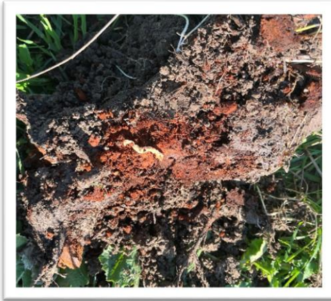
Фотография 7. Повреди от ларви по корена, източник: ОДБХ Варна

Ларвите имат характерна форма. Те нанасят основните повреди по корените на нападнатите растения.