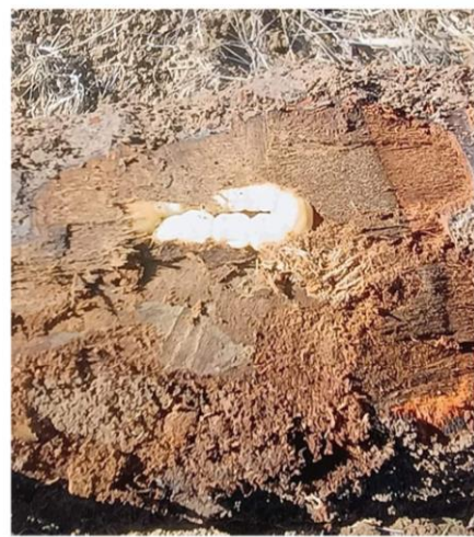
Фотография 9. Ларва в стъбло

Когато ларвите се намират върху страничен корен, повредите ясно се забелязват поради това, че корените са потънки и дървесината в тях е изядена, а коренчето е потъмняло и при отстраняване на кората се намират кафеникави стърготини. Нападнатите млади фиданки изсъхват бързо.